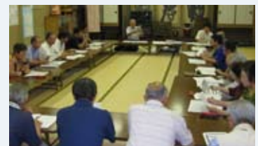
地域づくり会議のようす

この会議で生まれたアイデアを「江陽地域づくり計画」としてまとめ、現在は、計画で取り上げた活動の具体的な実践方法を検討しています。